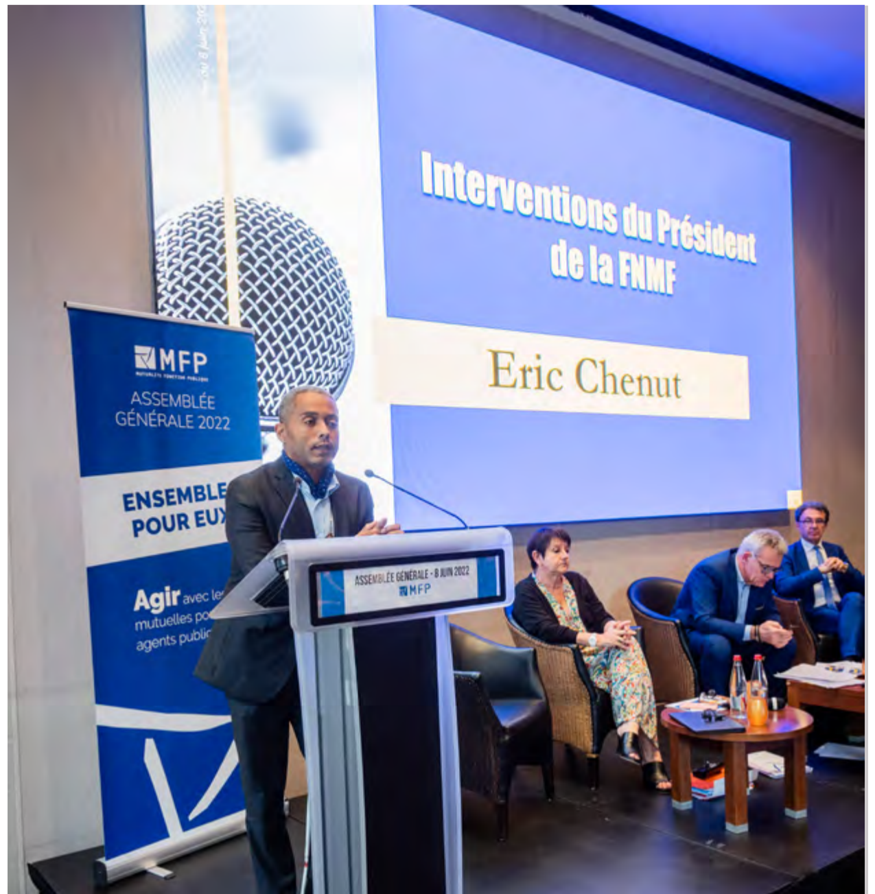
“ Le temps est venu de réfléchir au cadre optimal pour mieux irriguer le débat citoyen ”

Au plus près des citoyens, il est aussi essentiel de redéfinir l'organisation des services publics. Nous devons prendre position, ne pas morceler notre discours mais le porter en tant qu'acteurs de la société engagée. D'évidence, « les vents ne sont pas favorables, il faut se battre tous ensemble, être structurés pour conforter et renforcer notre influence ». Les sujets à faire avancer sont nombreux et notamment