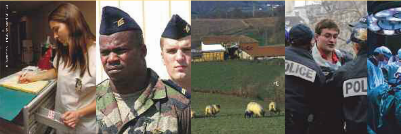
La RéATE regroupe des directions régionales des ministères et fusionne les directions départementales. Ainsi disparaissent les DDE, DDASS au profit des trois directions

C'est le plus grand plan de restructuration de France. Il concerne près de 260 000 agents, et l'employeur n'y va pas avec le dos de la cuiller. La réforme de l'administration territoriale de l'État (RéATE) réorganise complètement les services déconcentrés de l'État dans les régions et les départements. Et s'il bénéficiait au départ d'un soutien relatif des fonctionnaires, sa mise en œuvre précipitée et sans moyens suffisants les a fait déchanter. Selon un sondage Ifop-Acteurs publics d'octobre 2009, 65 % d'entre eux approuvaient, avant sa mise en place au 1 er janvier en province (1) , cette réforme des préfetures et des services déconcentrés des ministères, et 52 % considéraient qu'elle allait permettre aux collectivités locales et aux services publics de gagner en efficacité. Les agents les plus optimistes étaient les plus jeunes (83 % des moins de 35 ans), les non-titulaires (78 %), et les fonctionnaires franciliens (68 %).