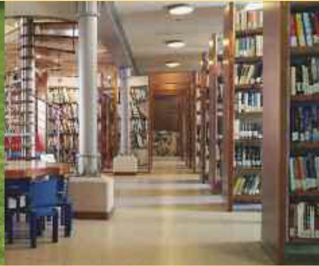
Jeunesse, sports et cohésion sociale sont regroupés à la DRSCS; la culture est à la DRAC; la DREAL englobe environnement, aména-